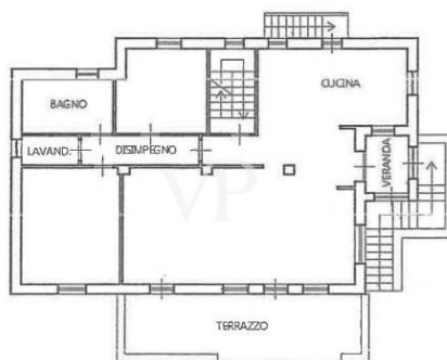
PIANO PRIMO H. = mt. 2,90